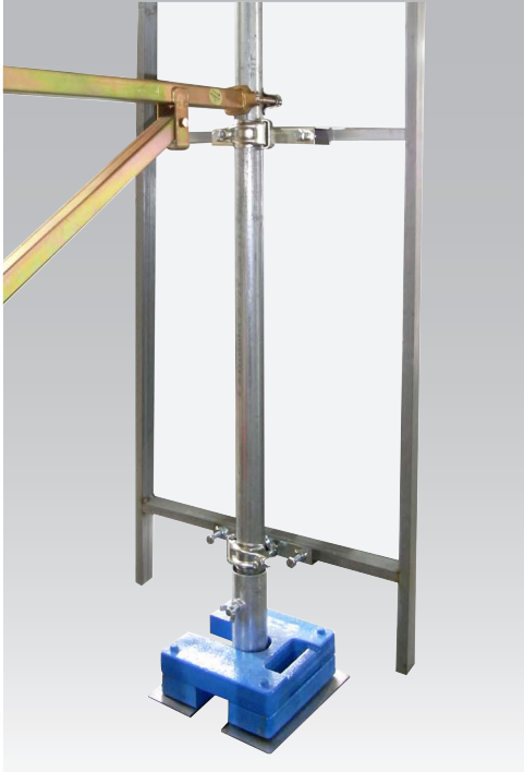
看板取付イメージ（19mm角鉄枠看板／マルチブロック使用）