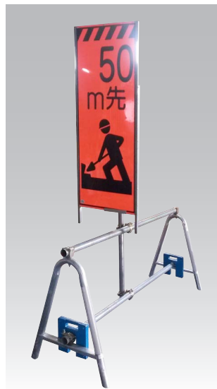
MAスタンドに看板取付