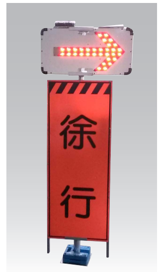
LED矢印板と看板を合わせて設置