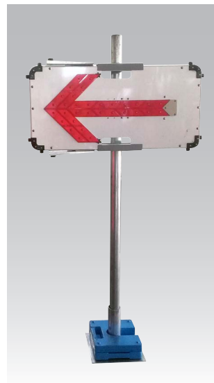
LED矢印板を高い位置に設置